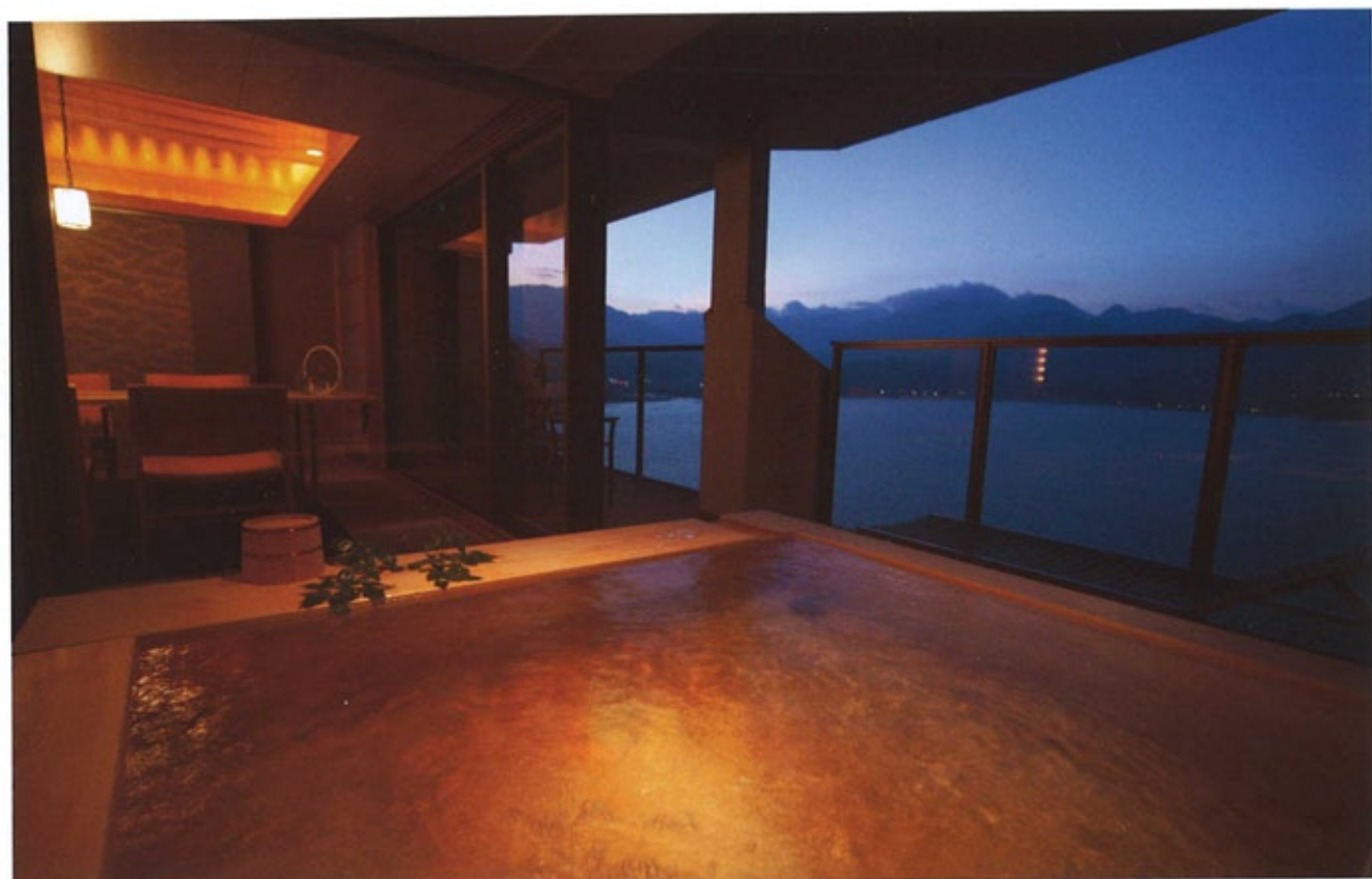
上/「伊奈美」の露天風呂。改修時に内側に外壁を移動し、屋外側を海を望む露天風呂とした 右/スイートルーム4室を備える様の専用ラウンジ