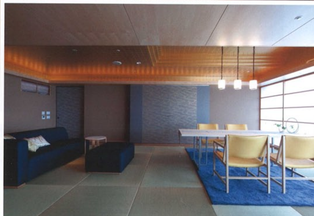
左/スイートルーム「鳥瑠奇」。元は2室あった空間をつなげ、広い1室とした。右上/スイートルームへの入り口。金属製の網代貼りの壁が迎える。右下/スイートルーム「伊奈美」。天井面には金色のクロスが貼られた。中央の扉は収納スペース。「鳥瑠奇」と左右対称のつくり