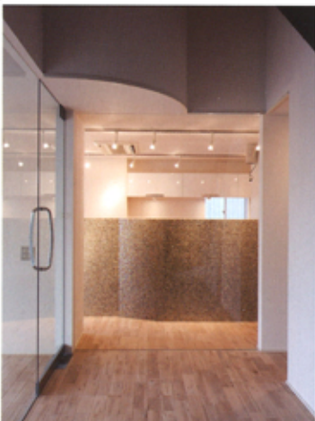
紅色に輝くベネツィアンガラスのモザイクタイルは奥様のお気に入り。

「古きものに手を加えることで、また新しいものとなる。これからは家族一人ひとりの「色」をつけていきながら、もっと良い家にしていきたい。」と語られる笑顔に、幸せな家族の風景が見えました。